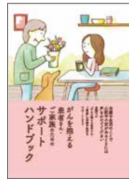
がんを抱える 患者さん・ご家族のための サポートハンドブック