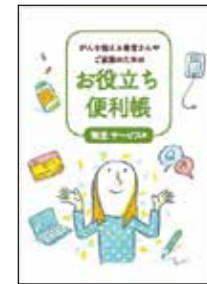
がんを抱える 患者さんや ご家族のための お役立ち便利帳 制度・サービス編