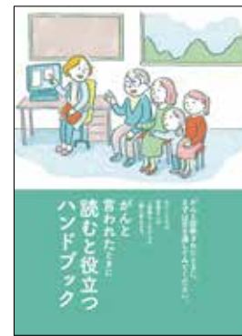
がんと言われたときに 読むと役立つ ハンドブック