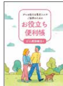
がんを抱える 患者さんや ご家族のための お役立ち便利帳 がん薬物療法編