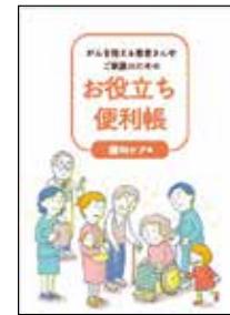
がんを抱える 患者さんや ご家族のための お役立ち便利帳 緩和ケア編