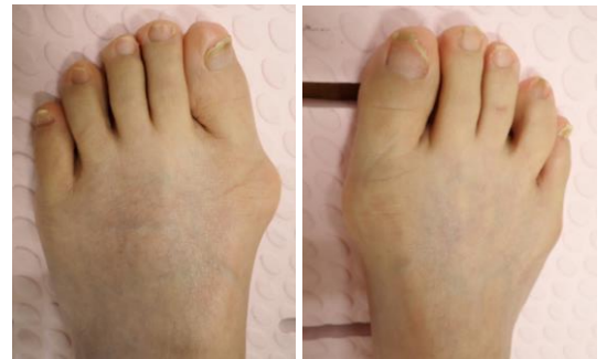
外反母趾変形 (2024年 7月)