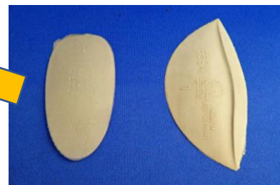
足底に合わせて、パッドを貼付